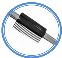
124 Harjan puhdistuskampa

Harjan kahva ja harjapesä valmistetaan kierrätysmuoviseoksesta.